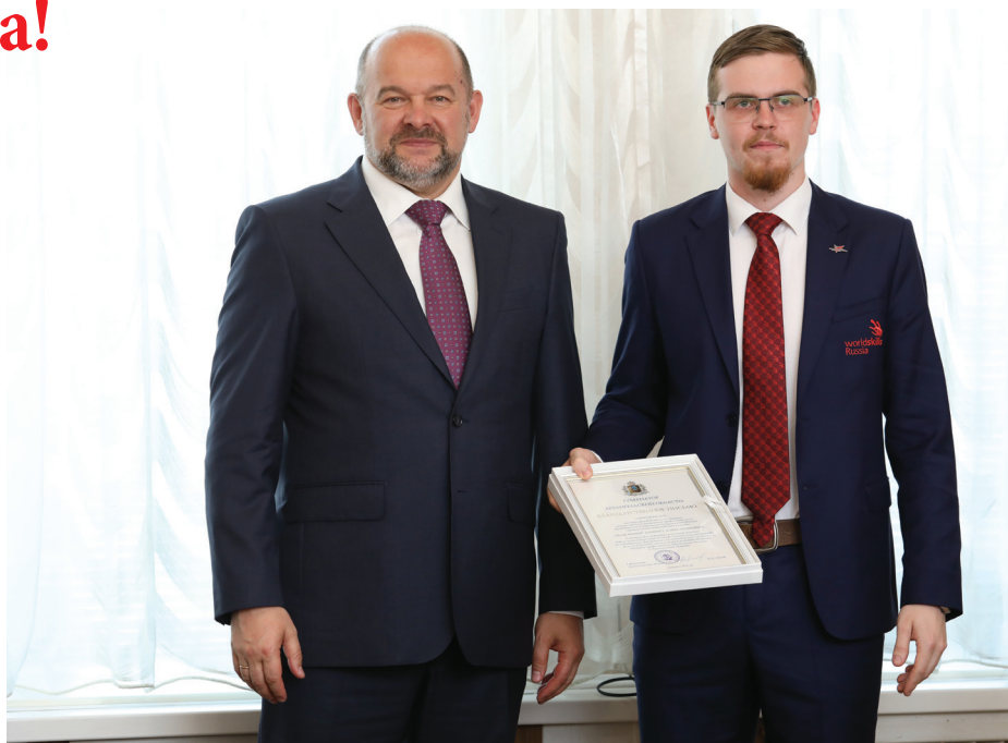
Даниил с губернатором Архангельской области И. Орловым

Осенью 2018 года на 13-ом Европейском чемпионате по плотницкому делу в Люксембурге Даниил занял пятое место. Он показал лучший результат в российской команде.