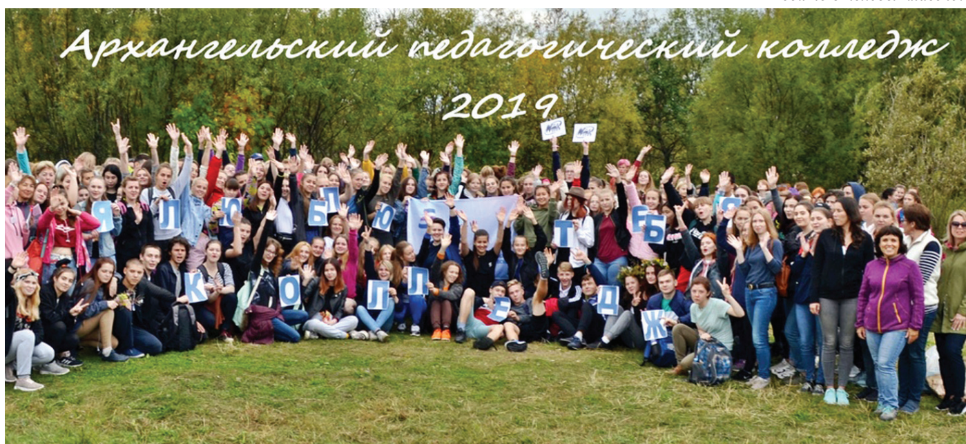
Поход первокурсника - начало студенческой жизни

Ходить в походы весело, Ходить в походы классно!