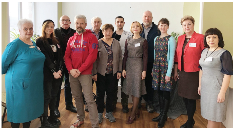
Делегация из Франции в Архангельском педагогическом колледже