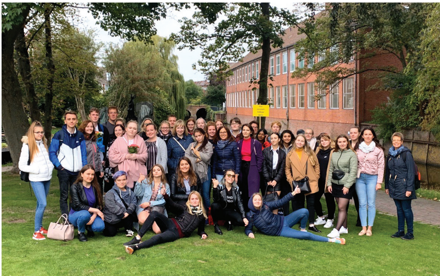
Участники международного проекта 2019 г.

именно так назывался проект, реализация которого началась в 2018 году в России в городах Санкт-Петербург и Архангельск, а продолжилась в году текущем с 16 по 26 сентября в Германии.