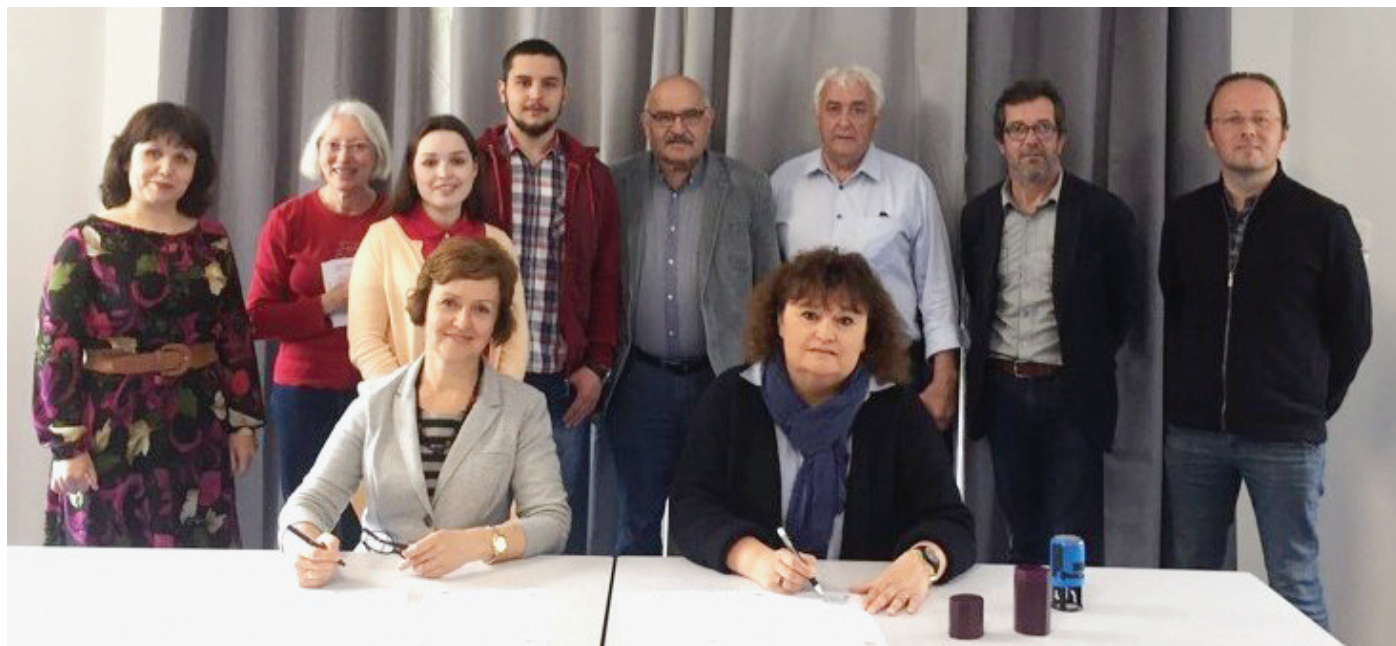
Подписание договора о сотрудничестве между ГБПОУ АО «Архангельский педагогический колледж» и Ассоциацией компаньонов