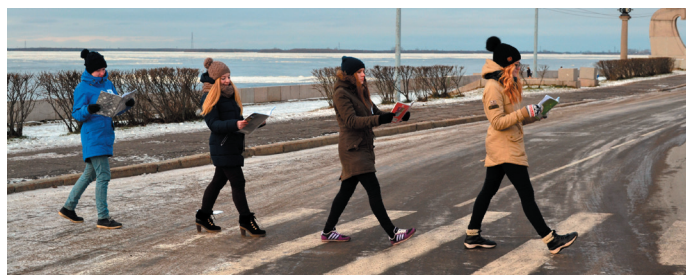
С книгой по городу (студенты группы 21(9)).

В 2015 году фестиваль проходит уже в 11 раз. Первый конкурс фестиваля – спортивный – «Большие литературные гонки», команда Архангельского педагогического колледжа «СБП» триумфально выиграла, оставив позади 11 команд!