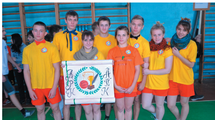
Команда Архангельского педколледжа - победители «Больших литературных гонок».

Городской фестиваль студенческого творчества «Виват, студент!» – это кладёз возможностей для каждого студента. Он позволяет почувствовать настоящий дух студенческой жизни, продемонстрировать свои таланты и завести новые знакомства.