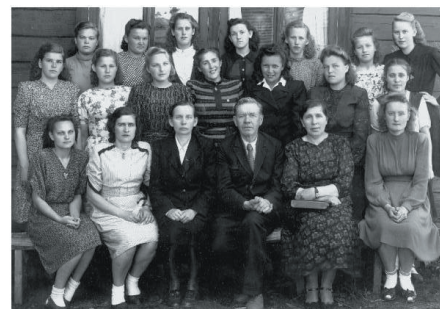
1949 г. выпуск специальности «Дошкольное образование»

Принципиальность, неравнодушие – качества характера М.И. Макаровой Это отмечала