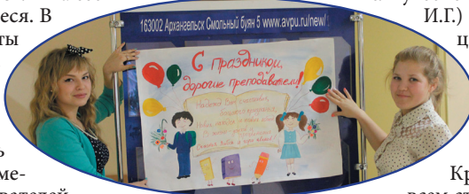
■ Студенты группы 22(9) поздравляют педагогов с праздником.