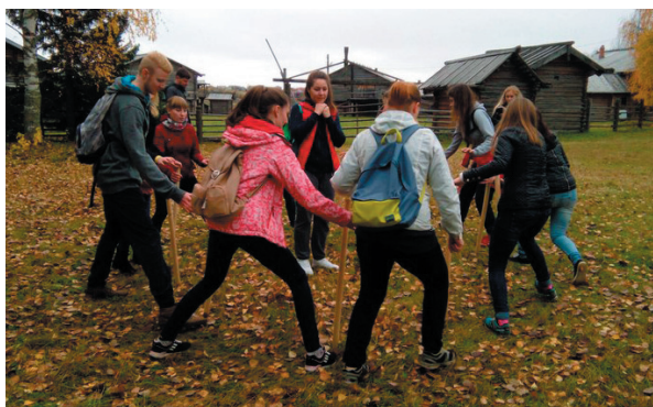
Студенты Архангельского педколледжа отметили День туризма в Малых Карелах.

метили профессиональный праздник. В этом году было принято решение провести этот день в музее деревянного зодчества «Малые Карелы». Студенты 30 группы специальности «Туризм» подготовили занимательную игру по станциям и предложили сыграть в неё остальным обучающимся по этой же специальности. Начало соревнований было открыто флешмобом. Каких только этапов нам не пришлось преодолеть! Но всем удалось максимально проявить свои таланты. И организаторы, и участники получили массу