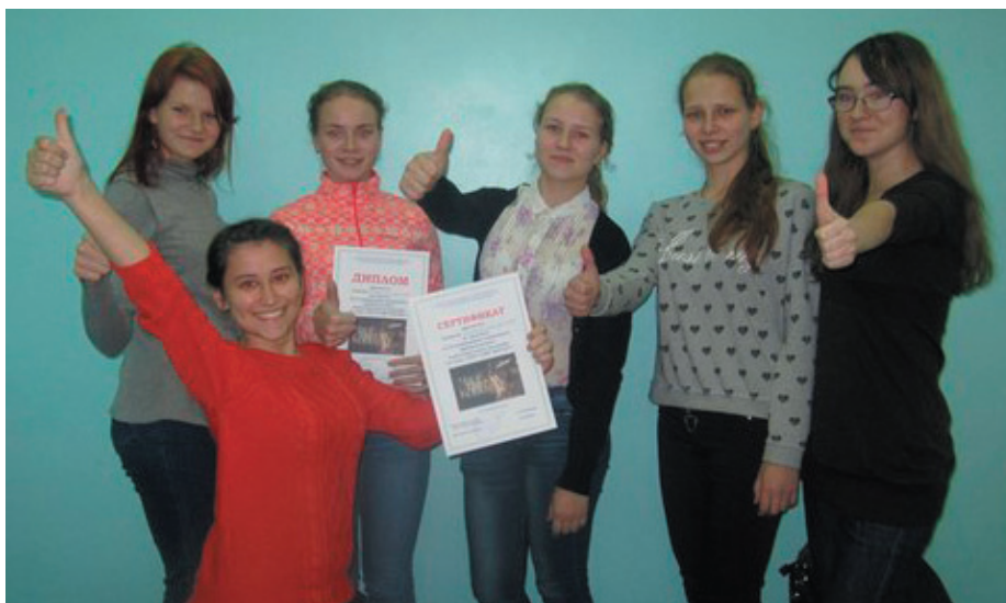
Победители второго чемпионата «Что? Где? Когда?» команда группы 11(9) А

По сумме баллов командами-победителями стали: