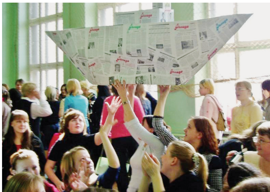
На празднике, посвященном выпуску 100-го номера газеты «Фелица» в 2007 г.

В апреле 2007 года вышел юбилейный сотый номер газеты, он открылся привет-