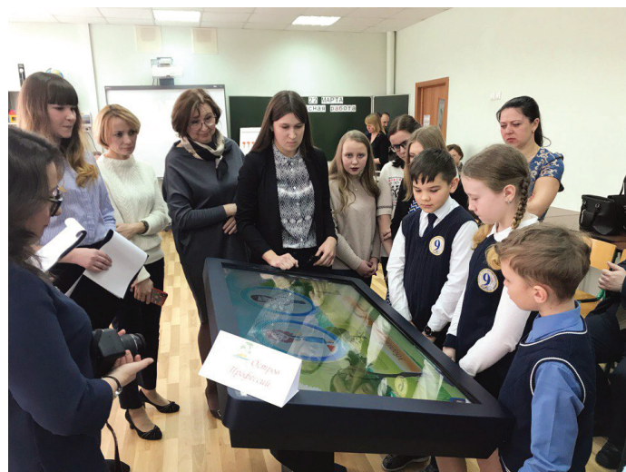
Знакомство с интерактивным столом

Вот как отреагировали обучающиеся первого курса по специальности «Преподавание в начальных классах» после посещения открывшейся Лаборатории: «Когда преподаватели нам сказали, что скоро в колледже для нас появится Лаборатория, мы обрадовались, так как знали о наличии в ней современного оборудования. Но когда у нас там прошло первое занятие, мы были поражены: реальность превзошла все наши ожидания! Нас очень впечатлила техника и её многообразие! Особенно нам понравились обучающие игры на интерактивном столе. Мы надеемся, что большинство занятий у нас будет проходить именно в этой Лаборатории!».