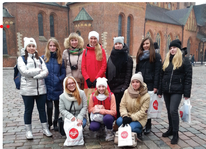
Архангельский педколледж в Латвии

Туристический автобус, отель с бассейном, сауной и вкусным завтраком, ночное плавание на 12-тиэтажном пароме – всё это оставило неизгладимое впечатление от проделанного путешествия, о чём свидетельствуют отзывы студентов: «Спасибо всем за эту замечательную неделю! Всё было здорово! Нужно будет повторить», «Всем большое спасибо! Эта поездка навсегда в моём сердце!